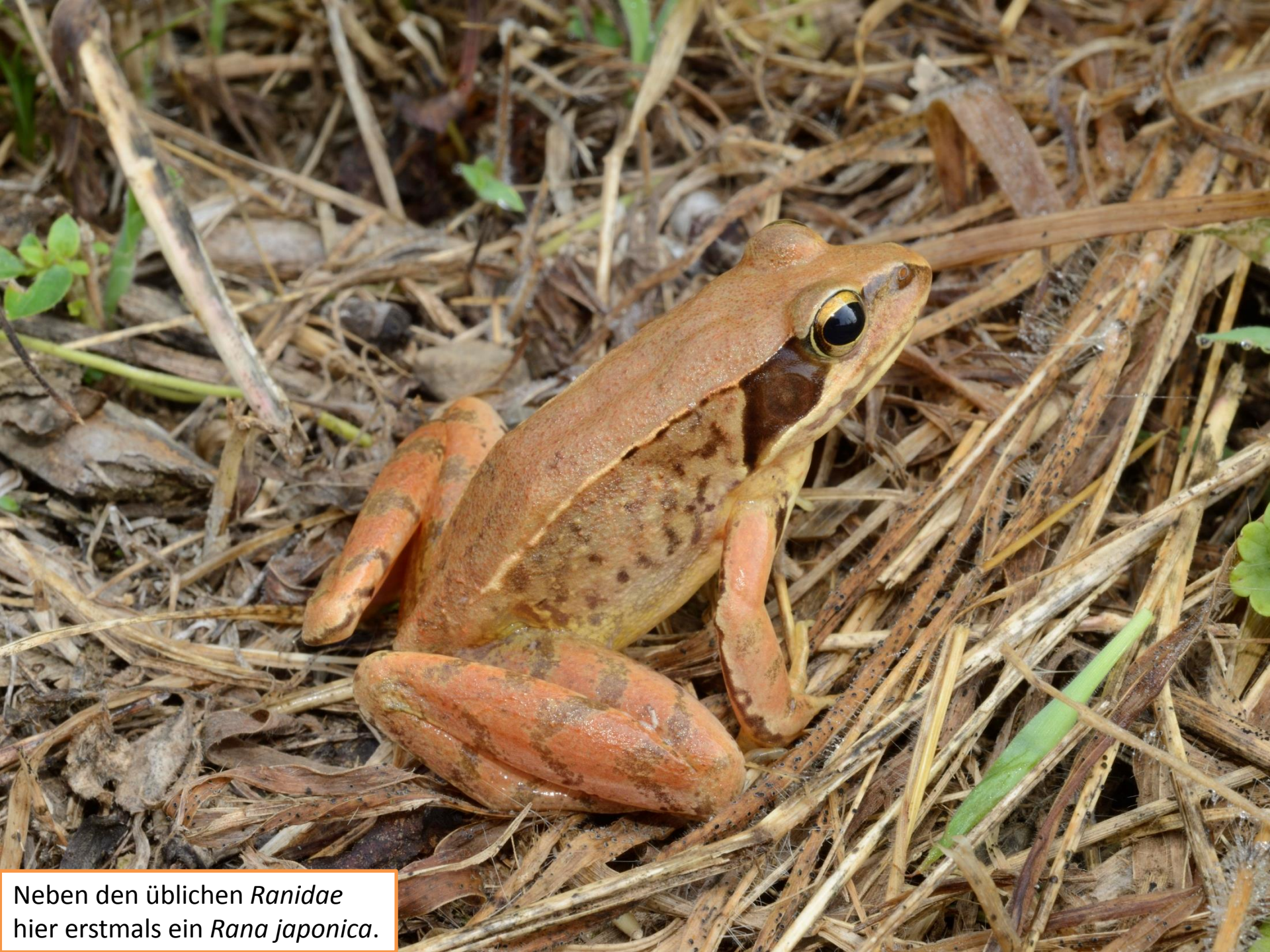
Neben den üblichen Ranidae hier erstmals ein Rana japonica .