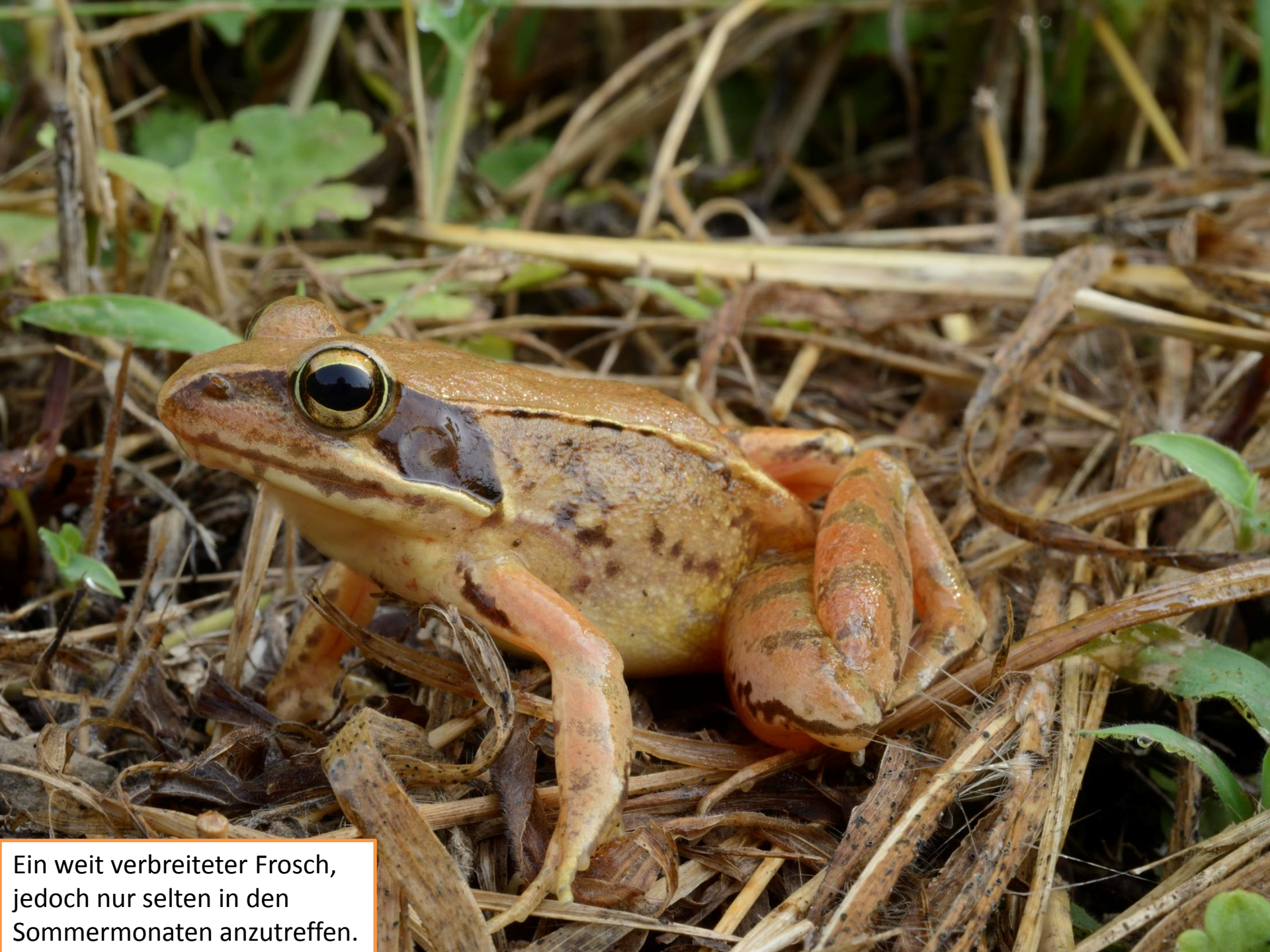
Ein weit verbreiteter Frosch, jedoch nur selten in den Sommermonaten anzutreffen.